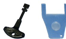
Clé de réarmement et outil de test